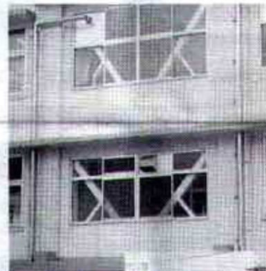
▲ガッツリと入った筋交い

てきたものです。その間に事務室や職員室は、二度も場所が変わったほか、校庭の片隅にプレハブの仮設教室を設けるなど、引越しも都合四回となりました。