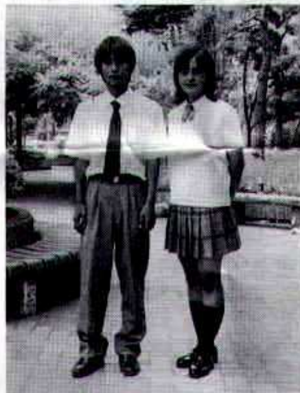
夏服（半袖シャツ・薄地のズボン・スカート）

なり、卒業までにもう一着読えらるることになります。それほど傷んでいない制服をすぐに捨てるには忍びないため、しばらくはタンスに入れるものの、結局はゴミになってしまいます。そこで、制服検討委員会では、この