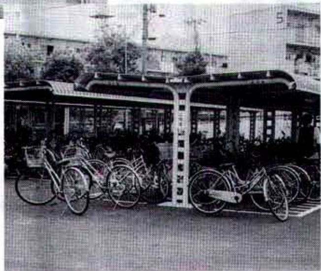
▲整然と置かれた通学用自転車