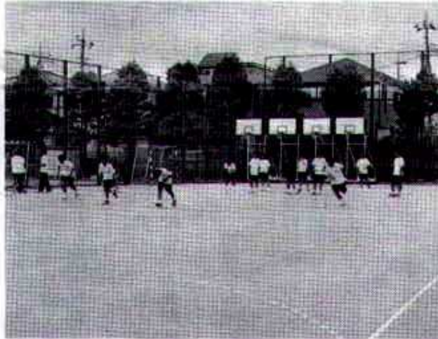
▲全天候型の多目的コートで練習に汗をかく

昭和三十八年に竣工した鉄筋校舎の耐震性に問題ありと診断されました。約十七億円の事業費と二年の月日をかけた工事が、このほど完工しました。大規模改修を終えた母校の見所をいくつかご紹介します。